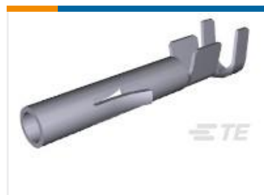
TE 产品编号350536-1 UMNL SOK 20-14 .0126 PTPBR