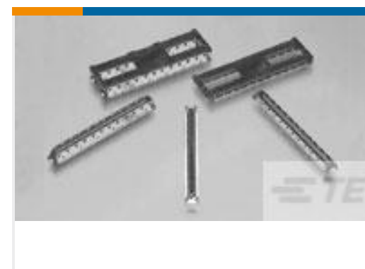
TE 产品编号3-1939756-6 .5FHP08H,220,S,GIG,30/Sn,HT,NS