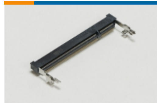
SO DIMM 插槽(13)