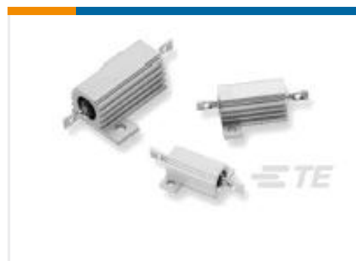
TE 产品编号2-1879074-0 THS15 27R 5%