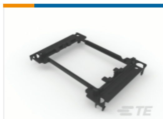
TE 产品编号2299806-1 NRW NON-FABRIC CARRIER, SOCKET P0