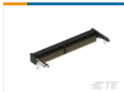
TE 产品编号2309413-3 DDR4 SODIMM 260P 9.2H STD