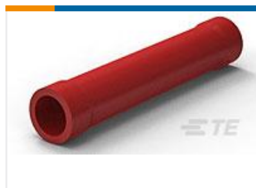
TE 产品编号34070 PG BUTT SPLC 22-16COMM22-18MIL