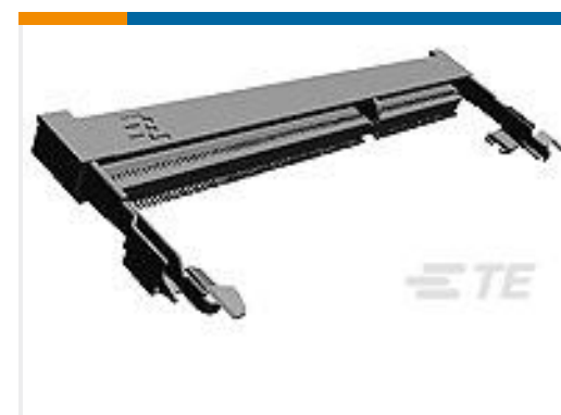
TE 产品编号2-2013311-1 EMBOSS TAPE DDR3 204P 9.2H RVS