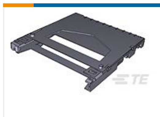
TE 产品编号1939115-1 SD CONN STD EMBOSS W/B REVERSE