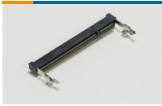
SO DIMM 插槽(13)