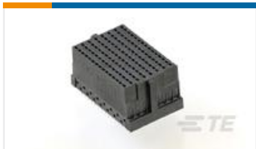
TE 产品编号1934949-1 Tinman 5pr 8col vert recpt 15mm stack