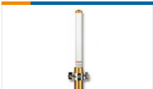
TE 产品编号FG821-18503 OMNI,DFG,821/1850MHZ 0/3dBd