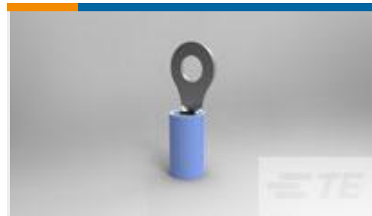
TE 产品编号320560 TERMINAL,PIDG R 16-14 8