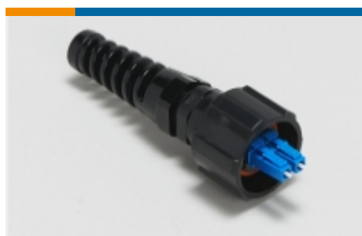
ODVA LC 连接器(3)