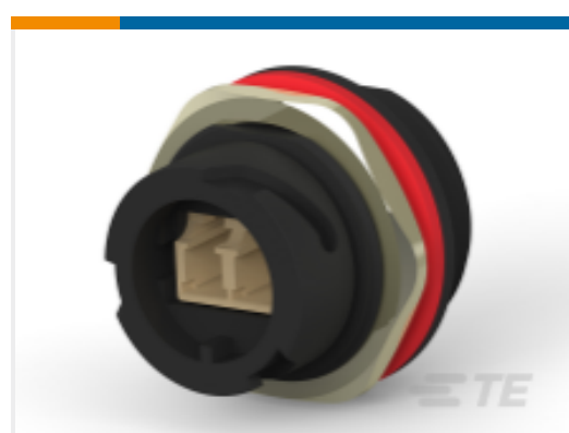
TE 产品编号 1828619-1 Kit,Receptacle,LC, ODVA,MM