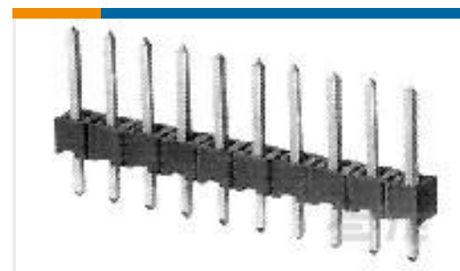
TE 产品编号1-826648-4 14P AMPMODU II STIFT LEI