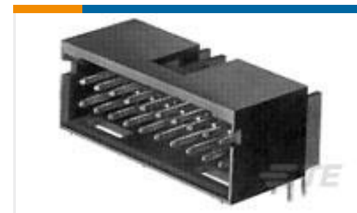
TE 产品编号5-103166-2 08 MODII HDR DRRA SHRD LF