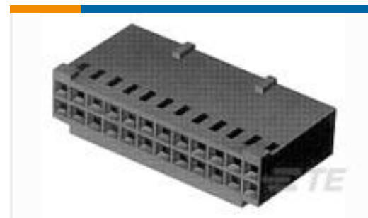
TE 产品编号87977-4 12 MODIV HSG DR MRKD .100 POL