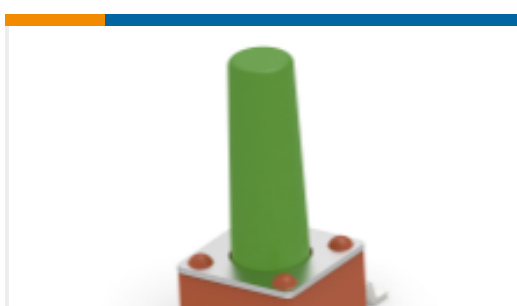
TE 产品编号2-1977223-8 FSM14JSMAAS=6MM TACT SWITCH, SMT 160gf