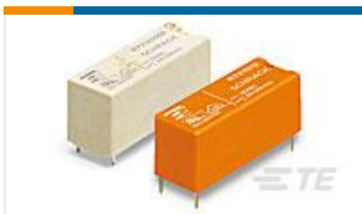
TE 产品编号8-1393224-9 RY533024