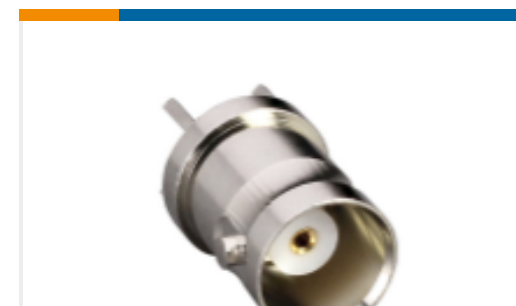
TE 产品编号CONBNC001 BNC Jack 50 Ohm PCB Through Hole