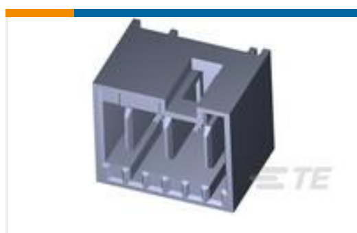
TE 产品编号5-1971846-3 3P, RAST 5 Tab Header, THV