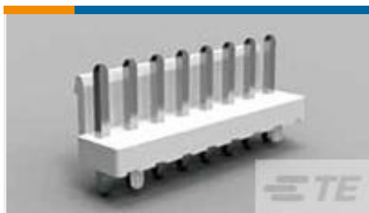
TE 产品编号1744429-7 3.96 EP HDR ASSY 7P W/PEGS, GW