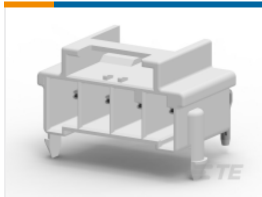
TE 产品编号1-1969694-4 PTL 1X4 PCB HEADER R/A HITEMP KEY A LGR