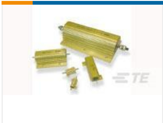
TE 产品编号1-1630019-4 HSC200 2K4 5%