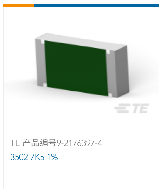
TE 产品编号9-2176397-4 3502 7K5 1%