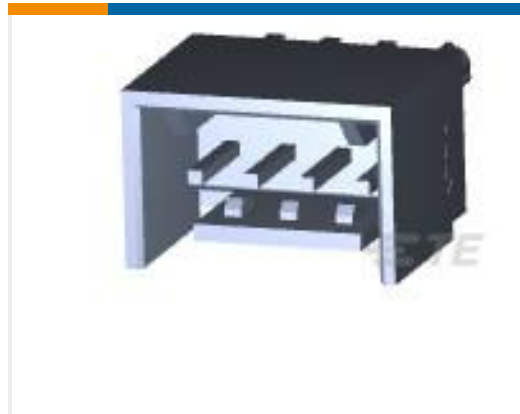
TE 产品编号2-644486-4 04P MTA100 SHRDED HDR ASSY SN