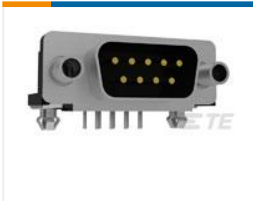
TE 产品编号5747840-6 HD-20 PLUG RA .318 FMS BD-LK S