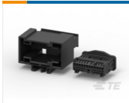
TE 产品编号1-1418639-5 MQS 连接器外壳