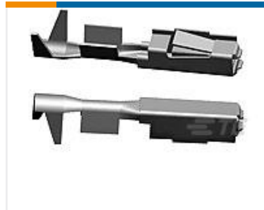
TE 产品编号5-928999-5 MQS0,63 Au rec LL unseal. >0,2-0,35