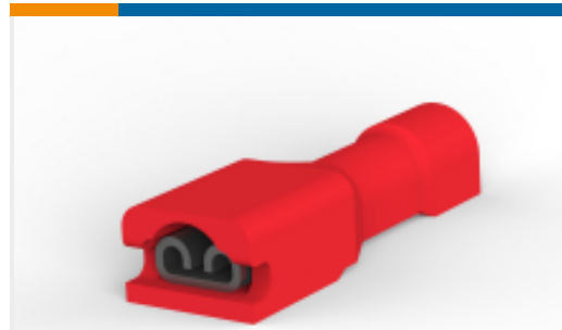
TE 产品编号2-521010-2 ULTRA-FAST .110/.125 ASY REC 22-18 TPBR