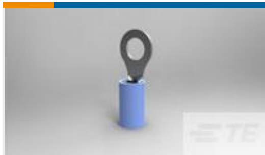
TE 产品编号53942-2 TERMINAL,PIDG R 16-14 10