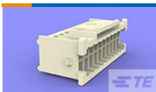
TE 产品编号 1-1969567-4 HOUSING, PLUG, GWT, DUAL ROW, EP2.5