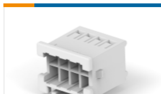
TE 产品编号 1969567-8 HOUSING, PLUG, GWT, DUAL ROW, EP2.5