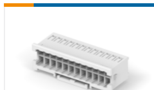
TE 产品编号 2-2323743-4 HOUSING, PLUG, GWT, 24P, DUAL ROW, EP2.5