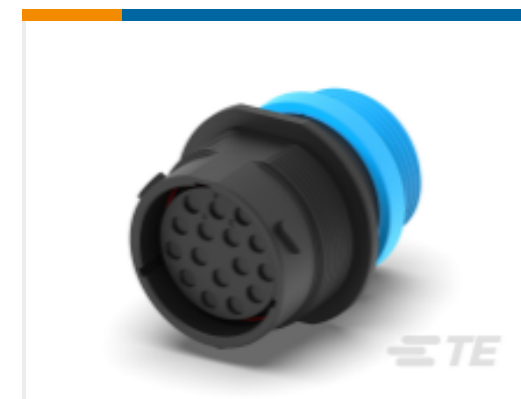
TE 产品编号HDP24-24-16SE-L015 REC, 16P, BLK, E, THD, 12, S