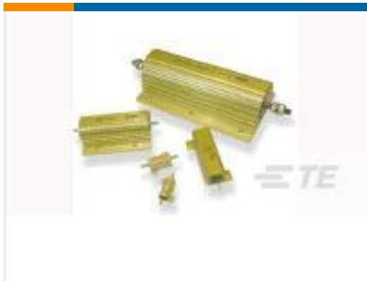
TE 产品编号1-1630019-4 HSC200 2K4 5%