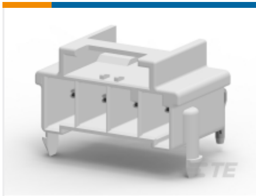
TE 产品编号1-1969694-4 PTL 1X4 PCB HEADER R/A HITEMP KEY A LGR