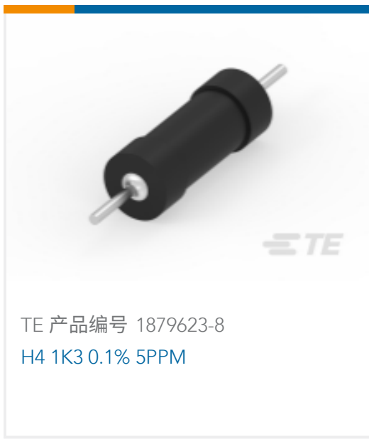
TE 产品编号 1879623-8 H4 1K3 0.1% 5PPM