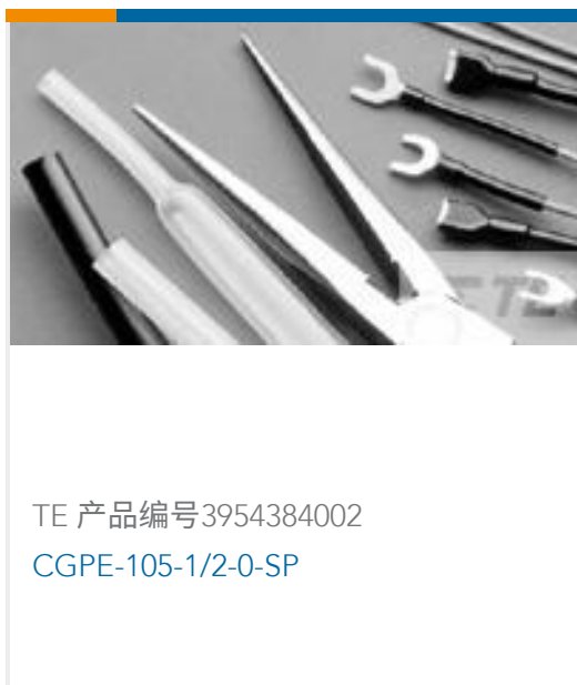
TE 产品编号 3954384002 CGPE-105-1/2-0-SP