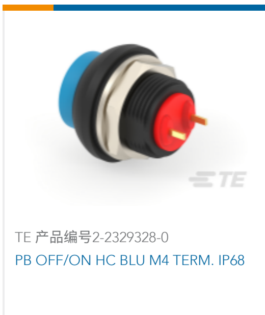
TE 产品编号 2-2329328-0 PB OFF/ON HC BLU M4 TERM. IP68