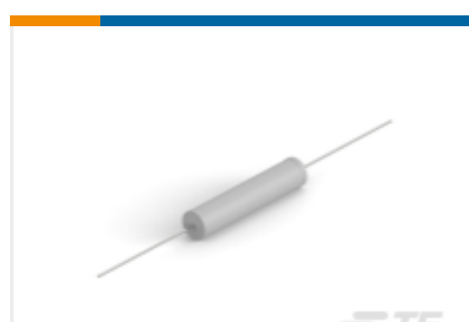
TE 产品编号9-2176415-0 8W STD M/OX 5% 150K