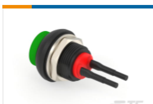
TE 产品编号2329359-9 PB ON/OFF HC GRE M1 TERM IP68 500MM LHS