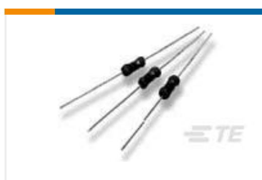
TE 产品编号1-1625893-3 5W SM M/OX 2% 22R