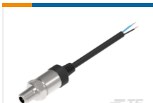
TE 产品编号20014203-12 PRESS XDCR M325M-000005-250PG