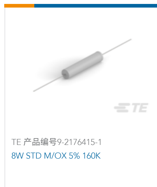
TE 产品编号9-2176415-1 8W STD M/OX 5% 160K