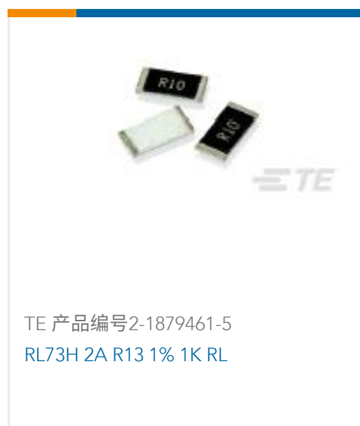
TE 产品编号2-1879461-5 RL73H 2A R13 1% 1K RL