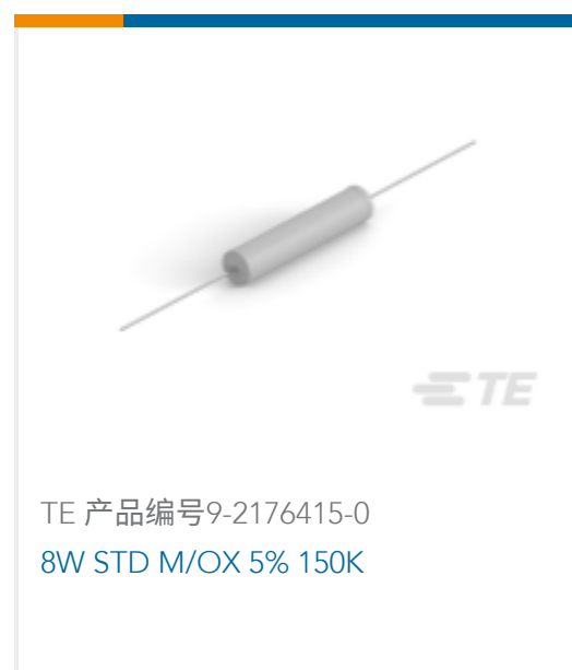
TE 产品编号9-2176415-0 8W STD M/OX 5% 150K