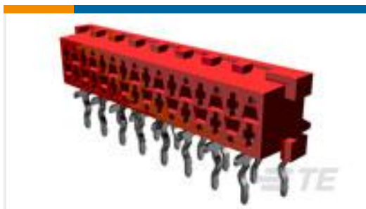
TE 产品编号9-215460-0 MICRO-MATCH FSID P