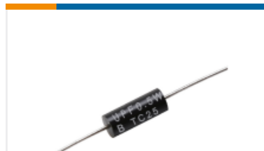
TE 产品编号2176163-1 UPF50 0.1% 5PPM 100K