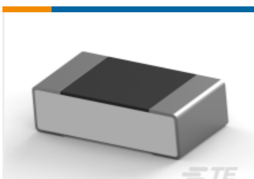
TE 产品编号5-2176370-3 RQ 0603 1K5 0.1% 10PPM 5K RL