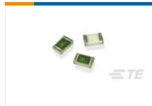
TE 产品编号3-1879135-8 RN 0603 255K 0.1% 10PPM 1K RL