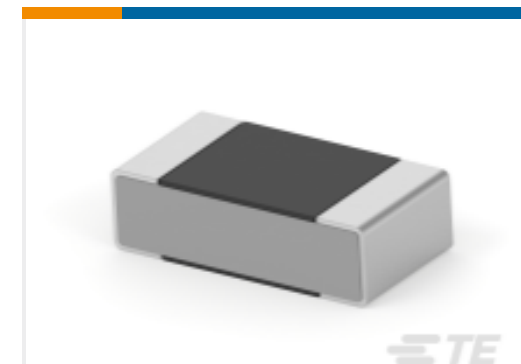
TE 产品编号3-1879207-8 RN 0603 374K 0.1% 10PPM 1K RL