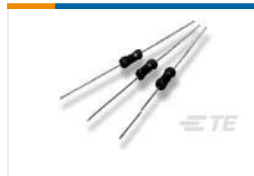
TE 产品编号2-1625890-0 2W SM M/OX 5% 1K0