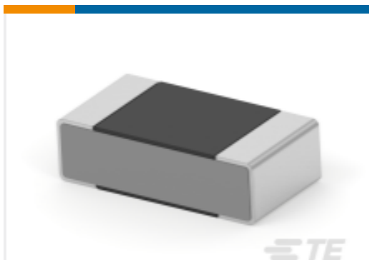
TE 产品编号6-1879417-5 CPF0603 562K 0.1% 25PPM 1K RL