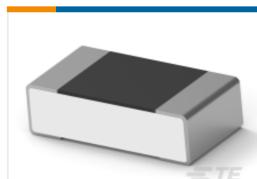
TE 产品编号5-2176366-3 RQ 0603 1K5 0.1% 10PPM 1K RL