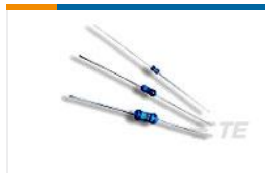
TE 产品编号1879026-4 YR1 0.1% 10R