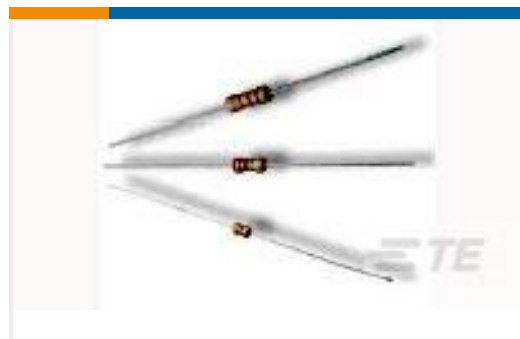
TE 产品编号6-1623927-3 CFR16 5% 2K2