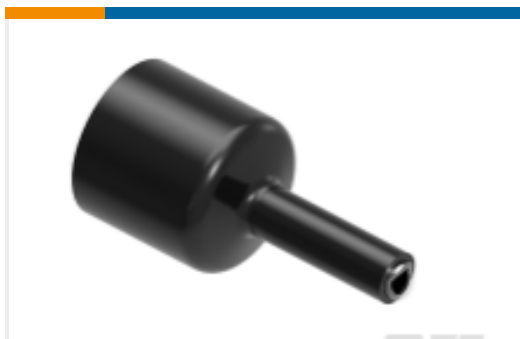
TE 产品编号NB08012001 HTAT-4/1-0-STK