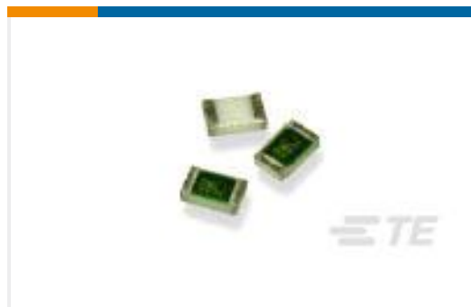
TE 产品编号5-1879215-8 CPF 0402 17K8 0.1% 25PPM 1K RL