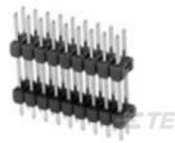
TE 产品编号5-146496-2 04 MODII HDR DRST UNSHRD STKG