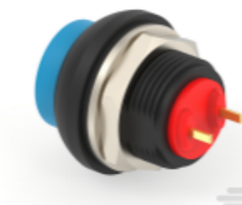
TE 产品编号2-2329328-0 PB OFF/ON HC BLU M4 TERM. IP68