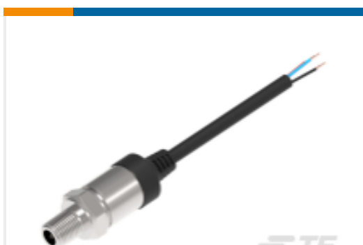
TE 产品编号20014203-12 PRESS XDCR M325M-000005-250PG