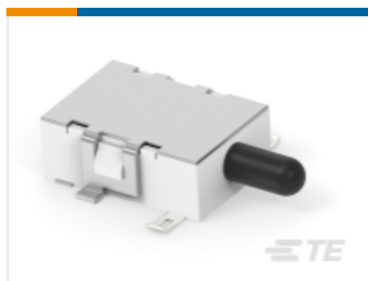
TE 产品编号2331327-1 DET SW5.7X4.0X2.0 GW HORZ. NC AG RL