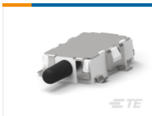
TE 产品编号2331393-1 DET SW5.7X4.0X2.0 GW HORZ. NO AG RL