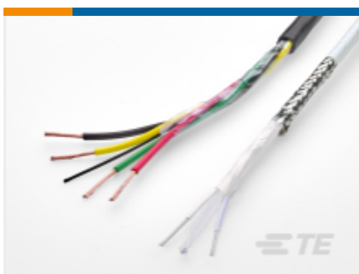
TE 产品编号CJ8735-000 2026G2424-9