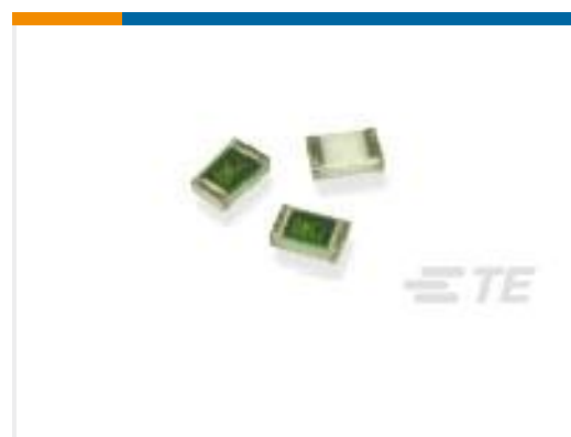
TE 产品编号2-1676971-0 RN 0805 243K 0.1% 10PPM CUT LENGTH