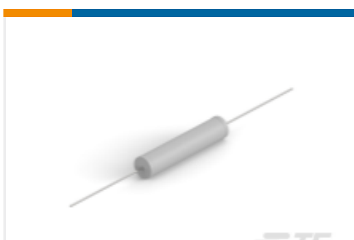
TE 产品编号9-2176415-1 8W STD M/OX 5% 160K