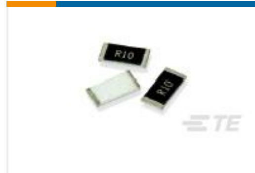
TE 产品编号2-1879461-5 RL73H 2A R13 1% 1K RL