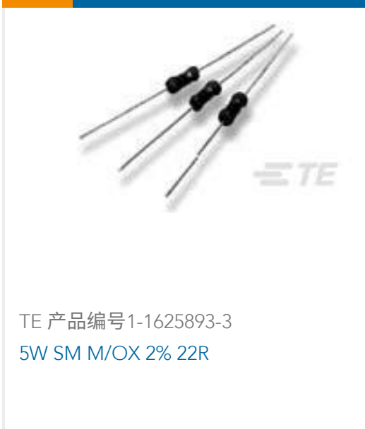
TE 产品编号1-1625893-3 5W SM M/OX 2% 22R