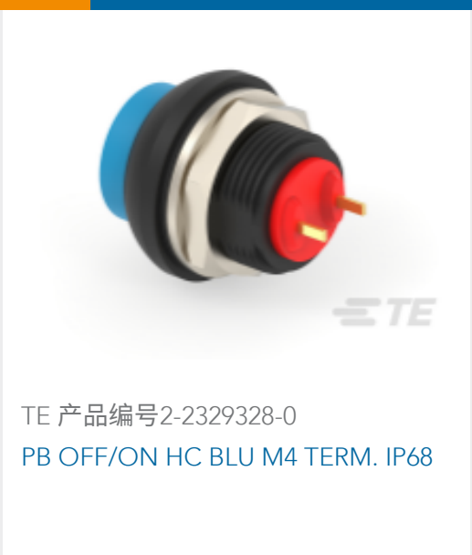
TE 产品编号2-2329328-0 PB OFF/ON HC BLU M4 TERM. IP68