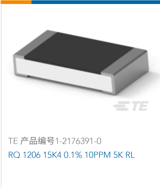
TE 产品编号1-2176391-0 RQ 1206 15K4 0.1% 10PPM 5K RL