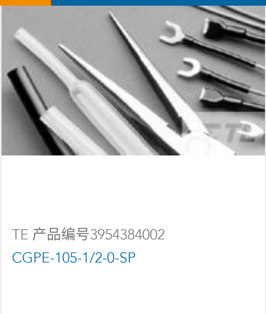
TE 产品编号3954384002 CGPE-105-1/2-0-SP