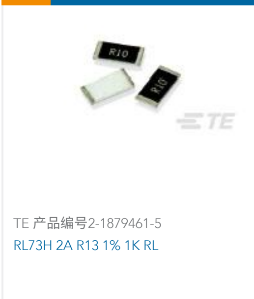
TE 产品编号2-1879461-5 RL73H 2A R13 1% 1K RL