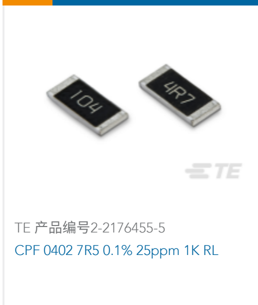
TE 产品编号2-2176455-5 CPF 0402 7R5 0.1% 25ppm 1K RL