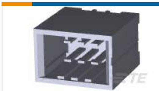
TE 产品编号178323-2 DYNAMIC D3100D HDR V 6P ASSY AU038