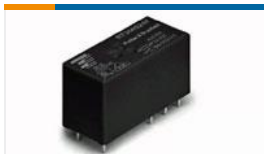
TE 产品编号2-1419108-5 RTB14012F