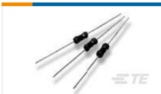
TE 产品编号1625890-6 2W SM M/OX 5% 10R