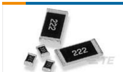
TE 产品编号1-1879502-2 CRGH2512 5% 39K 2W