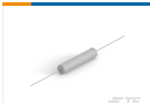
TE 产品编号9-2176415-1 8W STD M/OX 5% 160K