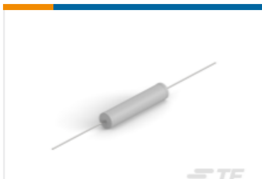
TE 产品编号9-2176415-0 8W STD M/OX 5% 150K