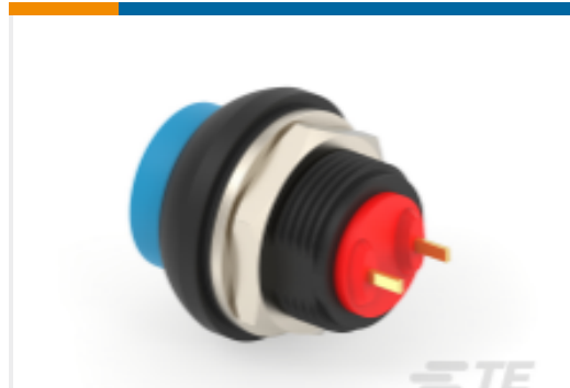
TE 产品编号2-2329328-0 PB OFF/ON HC BLU M4 TERM. IP68