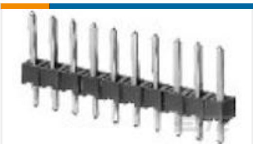
TE 产品编号5-146280-3 03 MODII HDR SRST B/A .100CL