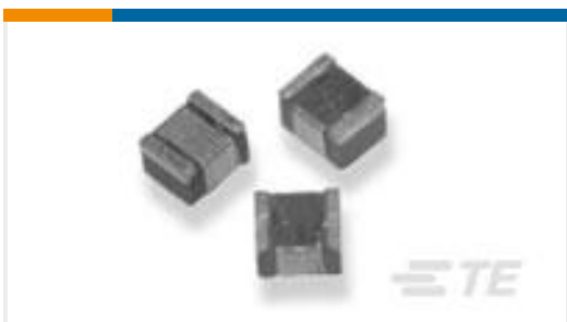
TE 产品编号7-1624112-0 3650 0603 7.5nH 5% 2K RL