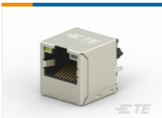
TE 产品编号5-2301995-3 RJ45 JACK INT.MAG. 10/100 LED 1X1 VERT.