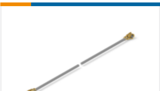
TE 产品编号2118651-6 RF CA,UMCC GEN1-GEN1,1.13MM, L90MM,GREY