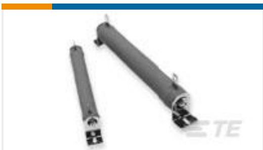
TE 产品编号2-1879447-1 TE 200W 47R 5% Bracket