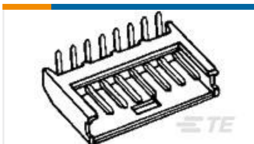
TE 产品编号280377-2 2P MODU II SHRD HDR,RT ANG, 0.38 AU