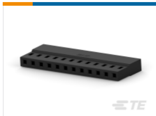
TE 产品编号1-2316102-2 12P,2MM,REC,HSG,SR,CRIMP,PLAIN, BOX