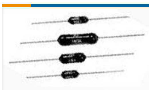
TE 产品编号6-1879646-3 H8 22K6 0.5% 50PPM