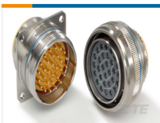
TE 产品编号ZPF0000000000036650 983-6S 18-31 S7