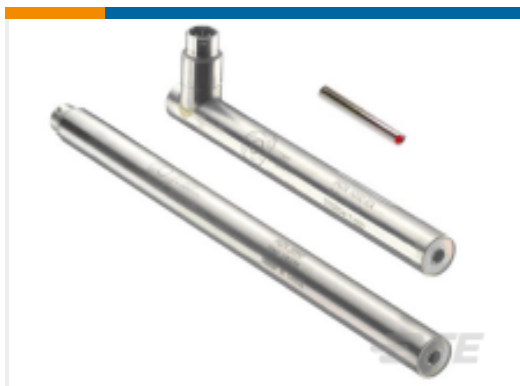
TE 产品编号02560413-000 LVDT HCA 050 ASSY