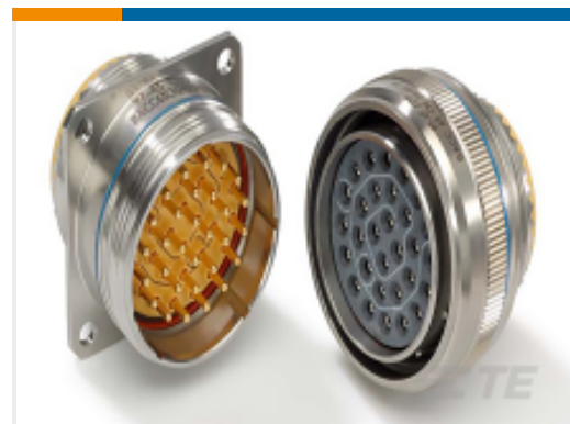
TE 产品编号ZPF000000000008615 983-6S 14-15 SN-L