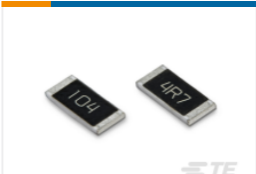
TE 产品编号2-2176455-5 CPF 0402 7R5 0.1% 25ppm 1K RL