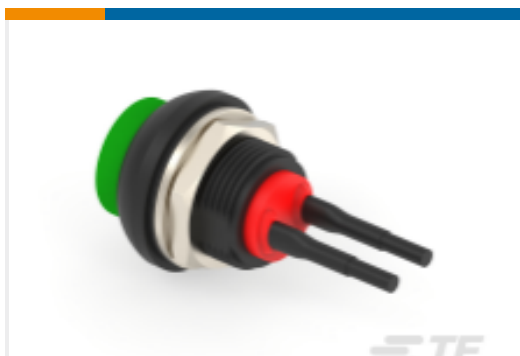
TE 产品编号2329359-9 PB ON/OFF HC GRE M1 TERM IP68 500MM LHS