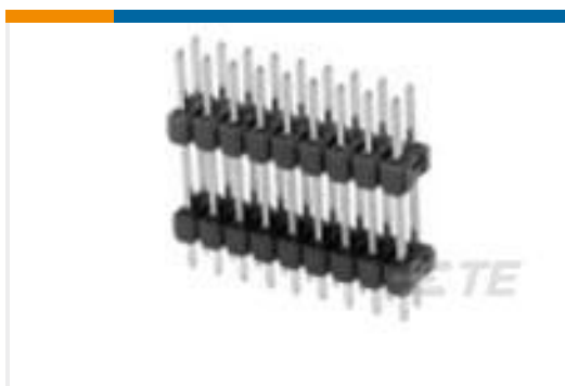
TE 产品编号5-146496-2 04 MODII HDR DRST UNSHRD STKG