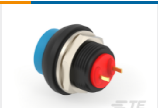
TE 产品编号2-2329328-0 PB OFF/ON HC BLU M4 TERM. IP68