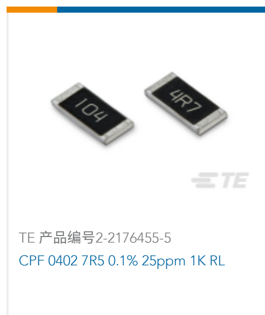
TE 产品编号2-2176455-5 CPF 0402 7R5 0.1% 25ppm 1K RL