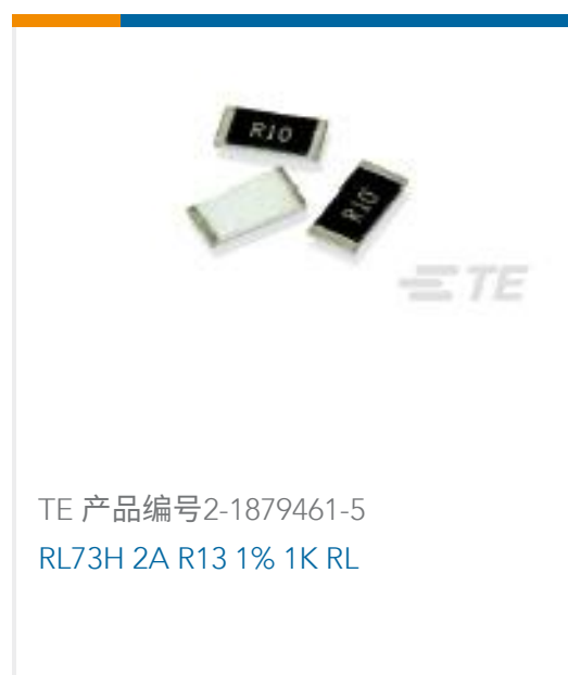
TE 产品编号2-1879461-5 RL73H 2A R13 1% 1K RL