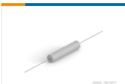
TE 产品编号9-2176415-1 8W STD M/OX 5% 160K