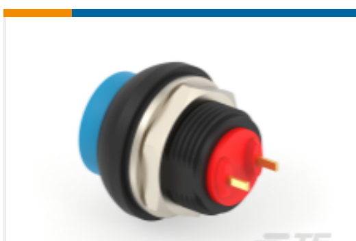
TE 产品编号2-2329328-0 PB OFF/ON HC BLU M4 TERM. IP68