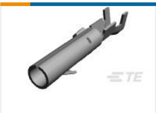
TE 产品编号61314-1 CMNL SOK 24-18 TPBR