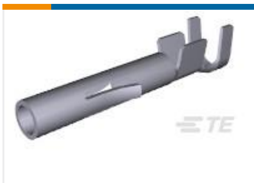
TE 产品编号350536-7 UMNL SOK 20-14 .0126 AUNI/BR