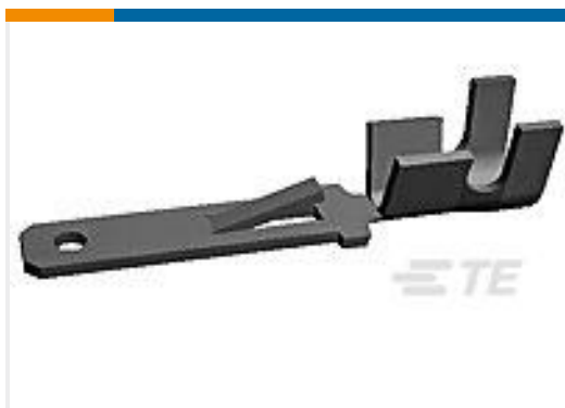
TE 产品编号928962-4 FF 250 TAB 17-13 AWG .016 TPBR