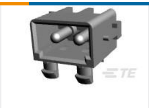
TE 产品编号794120-1 02P CMNL PC HDR ASSY RA