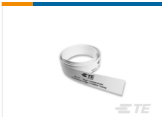
TE 产品编号EL7355-000 Continuous Tube High Temperature HT-CT