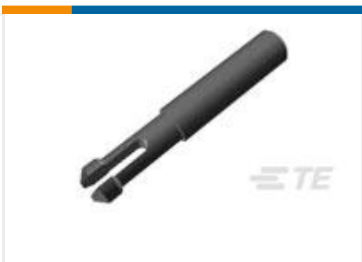
TE 产品编号1-640415-1 UMNL KEYING PLUG V2 NATL