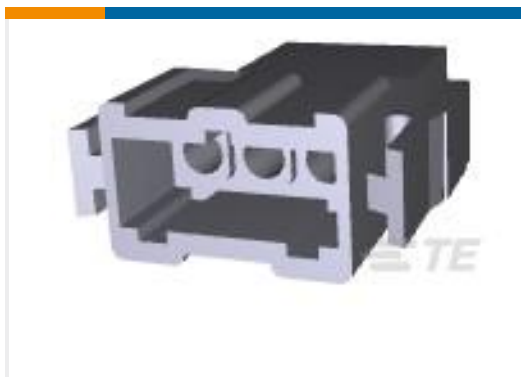
TE 产品编号207359-1 RECEPT HSG,3 POSN,METRIC