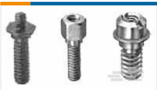
TE 产品编号750644-1 50SR SCREWLOCK KIT,FEMALE