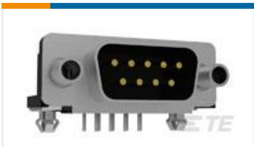
TE 产品编号5747840-6 HD-20 PLUG RA .318 FMS BD-LK S