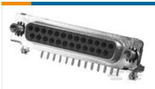
TE 产品编号5747844-2 09 MSFL RCPT RA 318 (FM,BL)