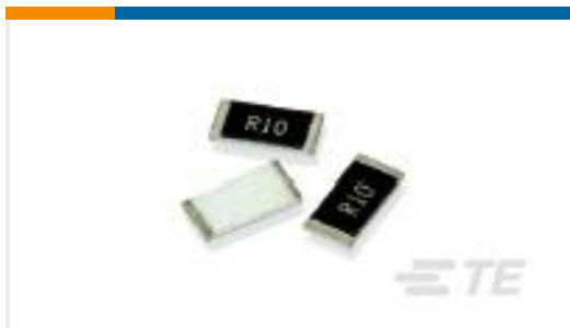
TE 产品编号1879463-3 RL73H 2E R12 1% 5K RL