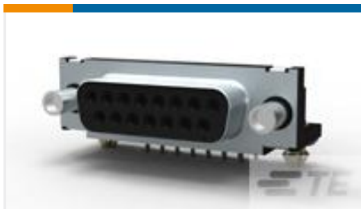
TE 产品编号5747845-6 15 MSFL RCPT RA 318 (SL,FM,BL)