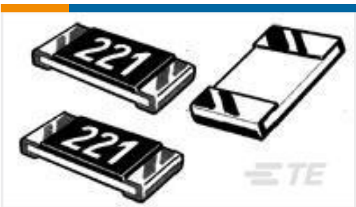
TE 产品编号2176231-3 3522 12R 1% 3W