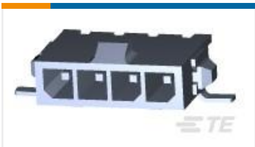
TE 产品编号2-1445057-4 MICRO MNL HDR ASSY SINGLE ROW