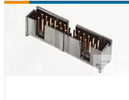
TE 产品编号2-1761603-9 IDC LOW PRO HDR 26P VERT BLUE