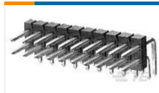
TE 产品编号826662-4 4P AMPMODU II STIFT LEI