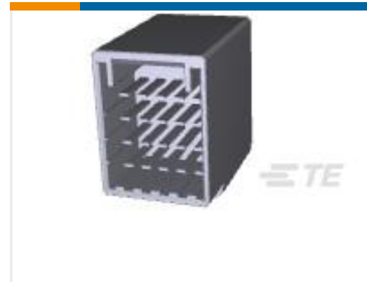
TE 产品编号917251-2 DYNAMIC D-3400F HDR ASSY 20P H