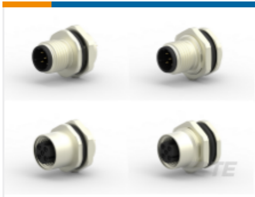
TE 产品编号T4133012051-000 M12 面板安装焊杯