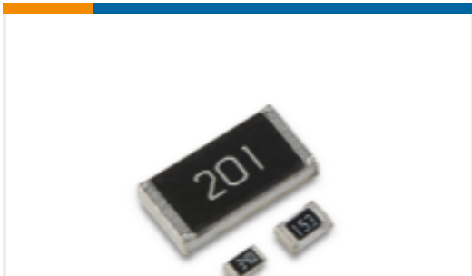
TE 产品编号2176326-5 CRGP 0603 22R 1%