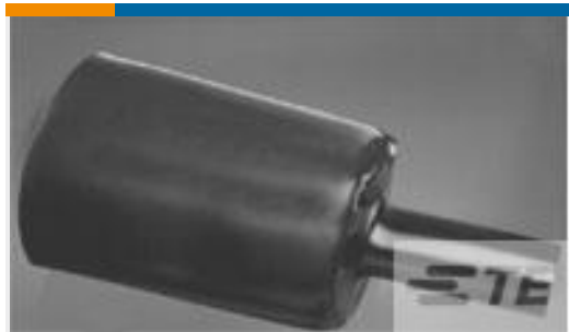
TE 产品编号CX7198-000 RHW-16/4-1200/ADH-0