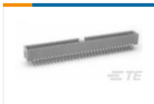
TE 产品编号2-1761605-3 IDC LOW PRO HDR 10P RA BLUE