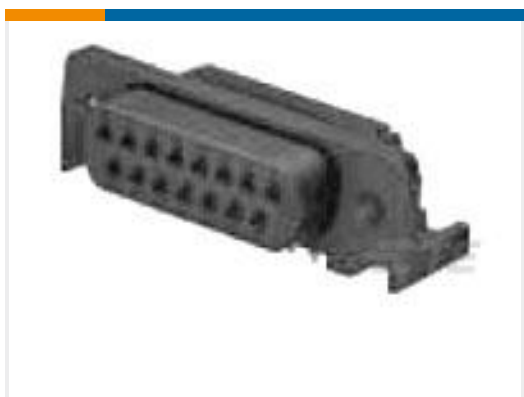
TE 产品编号5745395-2 HD-20 RCPT 9P RA 318 FFSCRLK