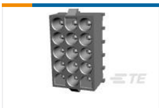
TE 产品编号350434-1 15P UMNL PIN HDR ASSY NATL