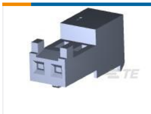
TE 产品编号3-643815-2 02P MTA100 CONN ASSY POL RIB