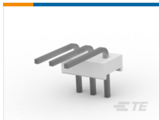
TE 产品编号640457-8 PCB Header: Polyester, Right Angle, Unshrouded