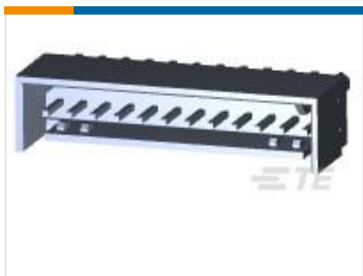
TE 产品编号3-644486-2 12P MTA100 SHRDED HDR ASSY SN