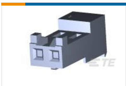
TE 产品编号3-643817-2 02P MTA156 CONN ASSY 18AWG ORA