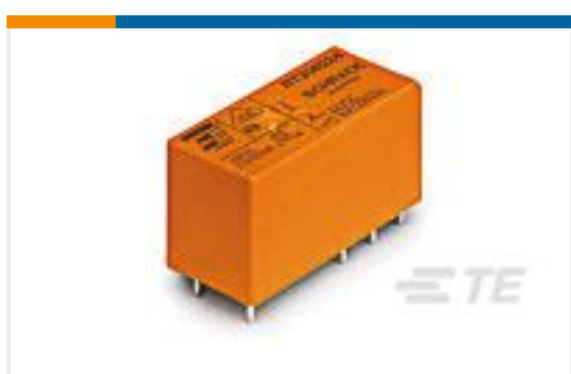
TE 产品编号6-1393243-8 RT424024