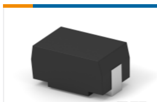
TE 产品编号6-1879233-2 SMD 功率电阻器：7 瓦特，.10-500 欧姆