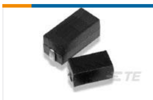
TE 产品编号1879234-3 SMF5 620R 5%