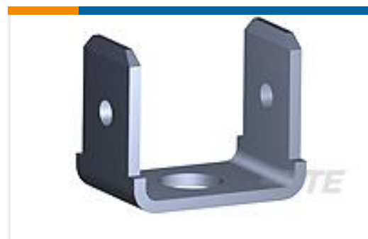
TE 产品编号41482 250 FASTON TAB TPBR