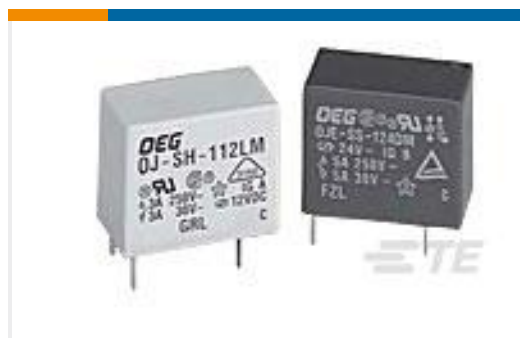
TE 产品编号1461404-1 OJ-SH-105LM,000