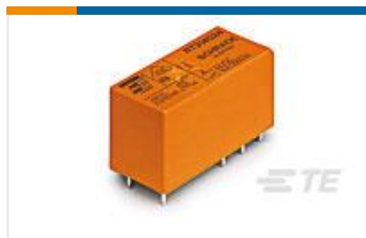
TE 产品编号5-1393243-2 RT424F05