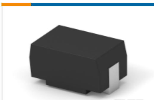
TE 产品编号5-1879021-1 SMD 功率电阻器：7 瓦特，.10-500 欧姆