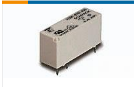
TE 产品编号9-1393222-1 V23061B1005A301=MINISTARKSTROM