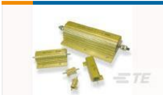
TE 产品编号7-1625984-2 HSA50 5K6 5%