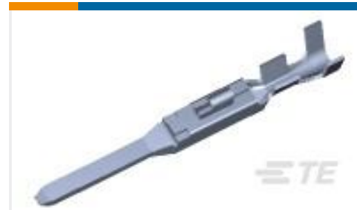
TE 产品编号175149-2 AMP UNIVE. POWER CONN TAB CONT