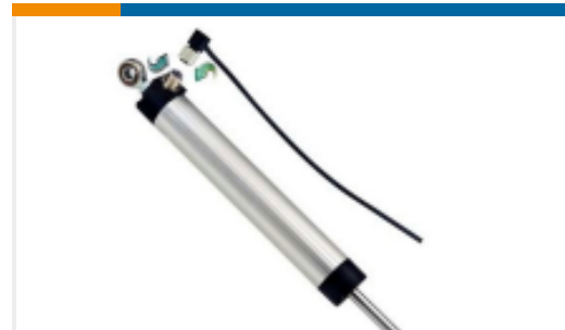
TE 产品编号04-1270-0020 CLWG-360-NC4