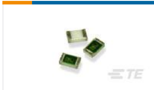
TE 产品编号1-1879215-2 CPF 0402 5K23 0.1% 25PPM 1K RL