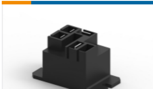
TE 产品编号1649341-2 T9CP1A54-240