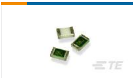
TE 产品编号6-1879208-7 CPF 0402 5K6 0.1% 25PPM 1K RL