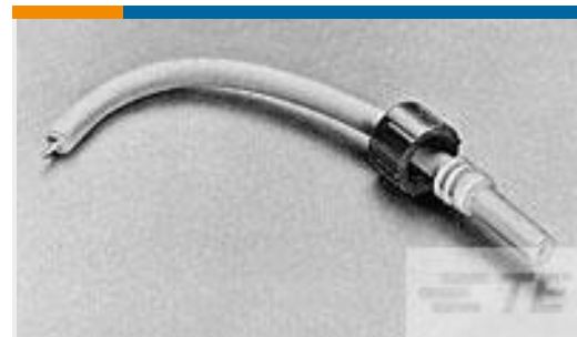
TE 产品编号1-830611-0 LGH 1/2 SNGL MLD END