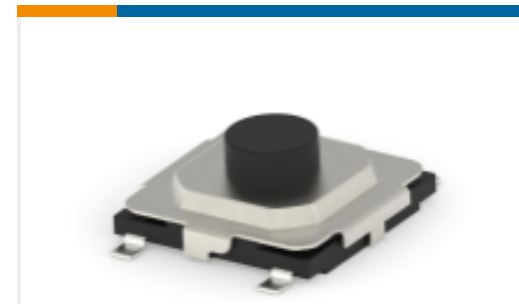
TE 产品编号2337238-3 TACT MINI GW 5.2X5.2X2 160GF