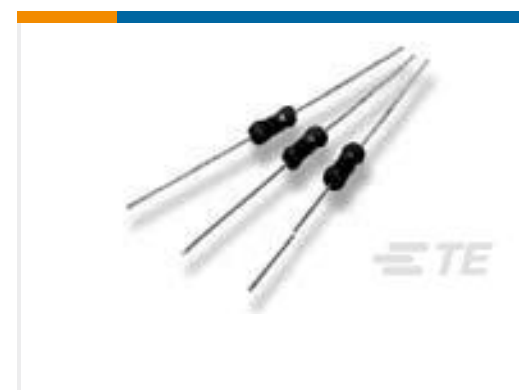
TE 产品编号1-1879353-9 RR02 5% 24K AMMO