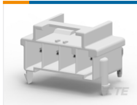
TE 产品编号1-1969694-4 PTL 1X4 PCB HEADER R/A HITEMP KEY A LGR