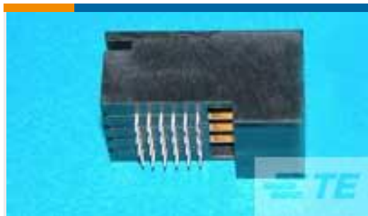
TE 产品编号1-1410279-1 MULTIGIG RT PWR .8" R/A HDR 2P PBFR