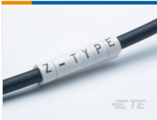
TE 产品编号EC0040-000 05801900