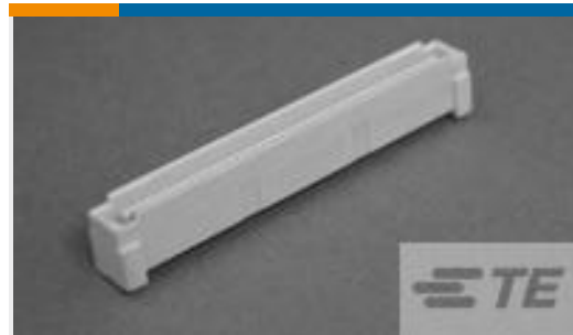
TE 产品编号3-5177986-1 0.8FH,P08H.5,040,08/Sn,TR,SC