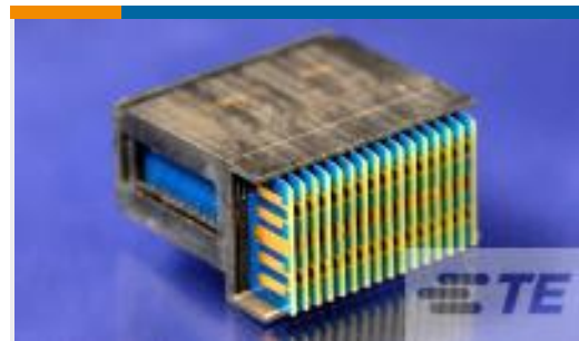
TE 产品编号1410421-4 MULTIGIG RT T1 .8" DC DF F-STD PBFR