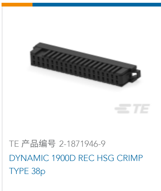
TE 产品编号 2-1871946-9 DYNAMIC 1900D REC HSG CRIMP TYPE 38p