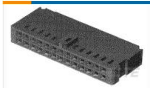
TE 产品编号102387-5 24 MODIV HSG COMP DR .100 POL