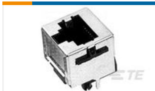
TE 产品编号3-1734577-2 MOD-JK,8P8C,SHD W/O LED, 15u" Au