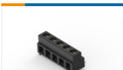
TE 产品编号2383938-5 TERMI-BLOK SMD MOUNT 180_5P_5 MM