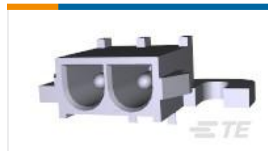
TE 产品编号1-350942-0 02P UMNL HDR ASSY R/A 94VO