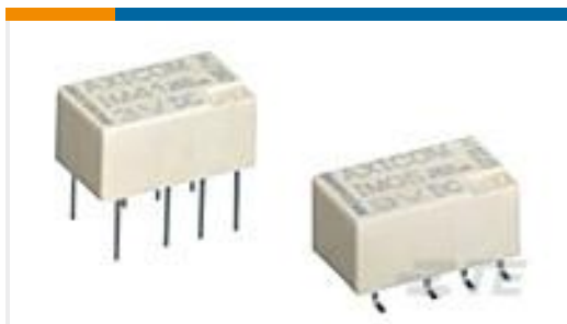
TE 产品编号2-1462039-6 IM21GR=IM RELAY 50mW 3V