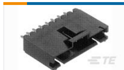
TE 产品编号103669-2 03 MTE HDR SRST LATCH W/HLDWN