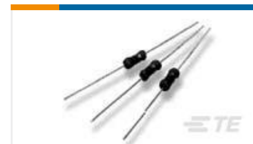
TE 产品编号4-1625885-3 1W SM M/OX 5% 220K