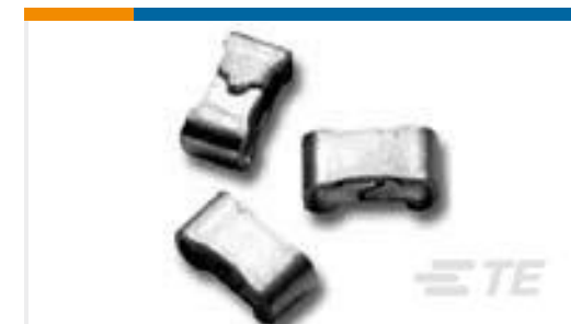
TE 产品编号1625854-1 1206 PROBE PAD