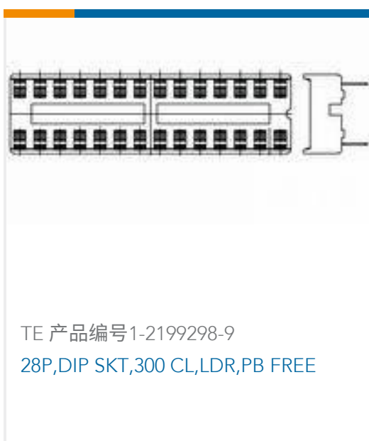
TE 产品编号1-2199298-9 28P,DIP SKT,300 CL,LDR,PB FREE