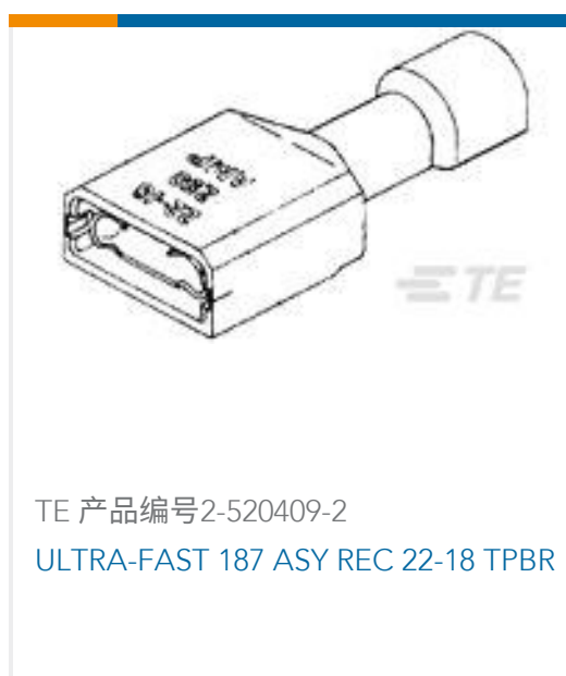
TE 产品编号2-520409-2 ULTRA-FAST 187 ASY REC 22-18 TPBR