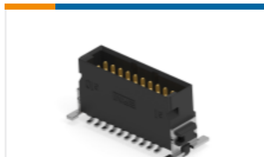
TE 产品编号254537-E SMCO 20 M AB VV 8-03 CL * H007 137 E005