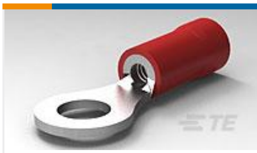
TE 产品编号34148 PG R 22-16 COMM 22-18 MIL 8