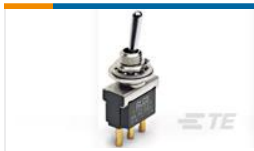
TE 产品编号4-6437630-8 FTH0904=MINIATURE TOGGLE