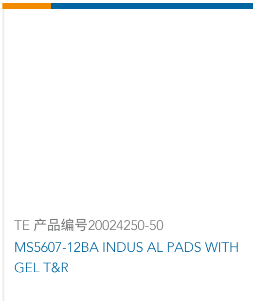
TE 产品编号20024250-50 MS5607-12BA INDUS AL PADS WITH GEL T&R