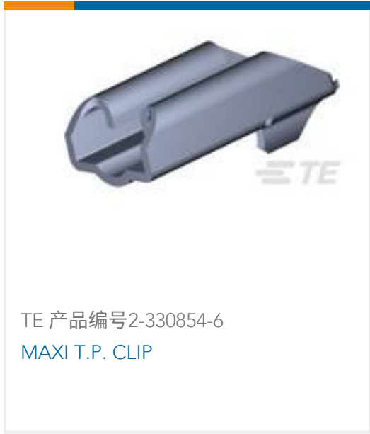
TE 产品编号2-330854-6 MAXI T.P. CLIP