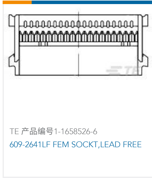
TE 产品编号1-1658526-6 609-2641LF FEM SOCKET, LEAD FREE