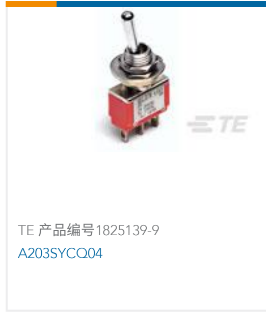
TE 产品编号1825139-9 A203SYCQ04