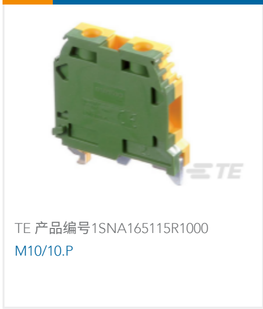
TE 产品编号1SNA165115R1000 M10/10.P