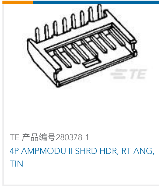
TE 产品编号280378-1 4P AMPMODU II SHRD HDR, RT ANG, TIN