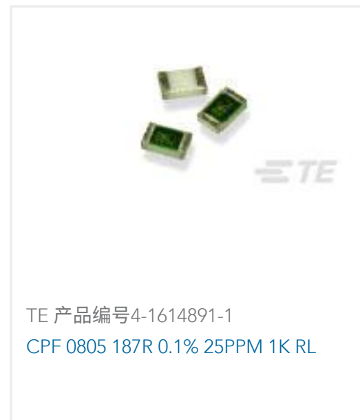
TE 产品编号4-1614891-1 CPF 0805 187R 0.1% 25PPM 1K RL