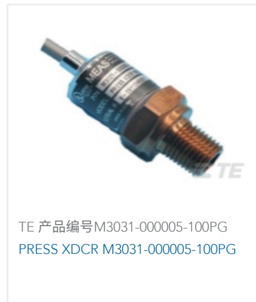
TE 产品编号M3031-000005-100PG PRESS XDCR M3031-000005-100PG