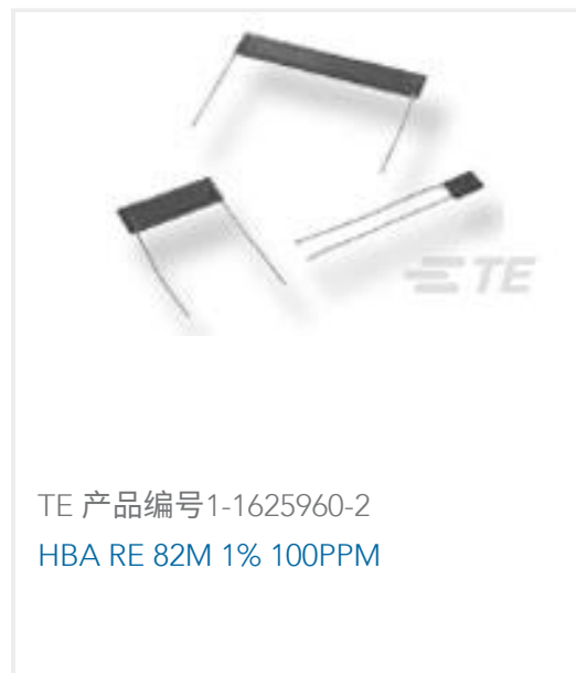
TE 产品编号1-1625960-2 HBA RE 82M 1% 100PPM