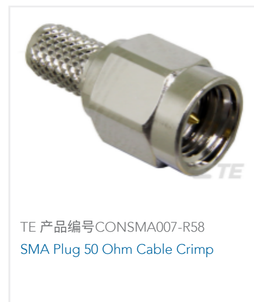
TE 产品编号CONSMA007-R58 SMA Plug 50 Ohm Cable Crimp