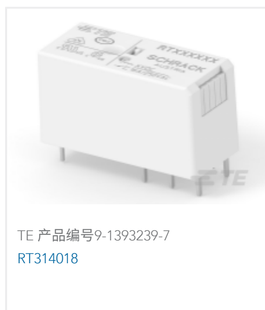
TE 产品编号9-1393239-7 RT314018