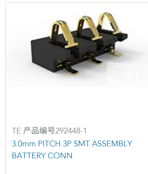
TE 产品编号292448-1 3.0mm PITCH 3P SMT ASSEMBLY BATTERY CONN