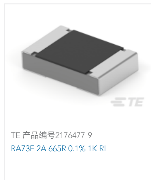
TE 产品编号2176477-9 RA73F 2A 665R 0.1% 1K RL