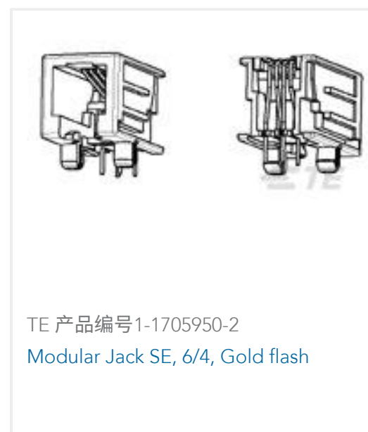
TE 产品编号1-1705950-2 Modular Jack SE, 6/4, Gold flash