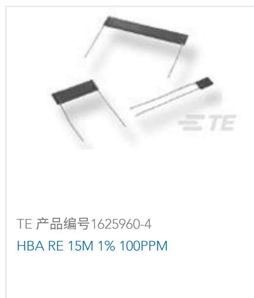
TE 产品编号1625960-4 HBA RE 15M 1% 100PPM