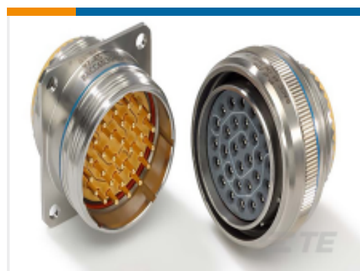
TE 产品编号ZPF000000000008208 983-6KE 10-06 PN-L