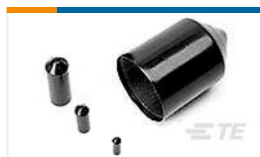
TE 产品编号016897-000 101A031-25/86-0