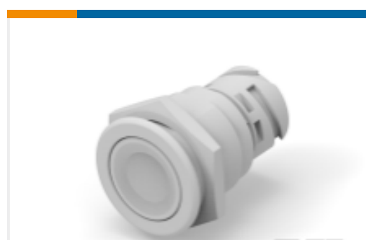
TE 产品编号K1160479 Push button switch TS-211-GE11