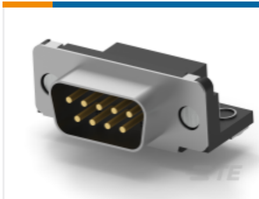
TE 产品编号5788792-1 D-Sub 插头组件：标准，直角，外壳尺寸 1，2.74mm